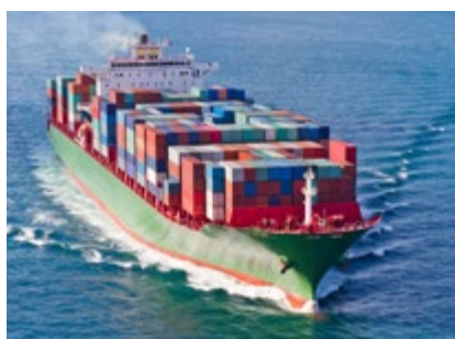
Multitech 400 Plus