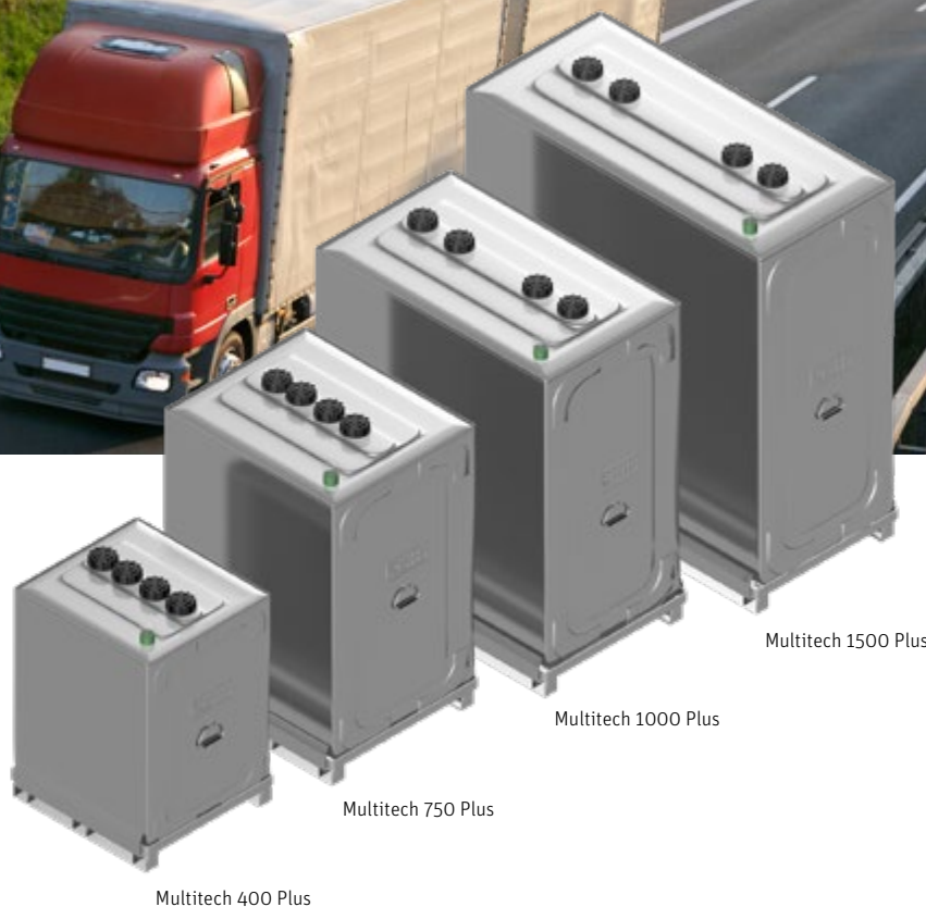
Multitech 1500 Plus