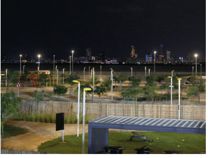
Abu Dhabi (EAU) - Luminaria Deco Horizon