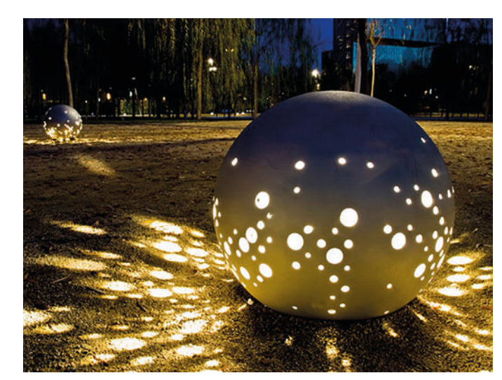
Barcelona (España) - Retrofit Benito Novatilu