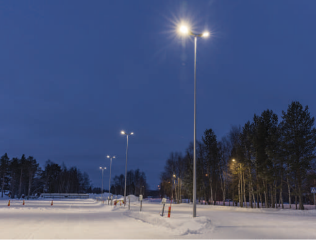
Laponia (Finlandia) - Luminaria Milan