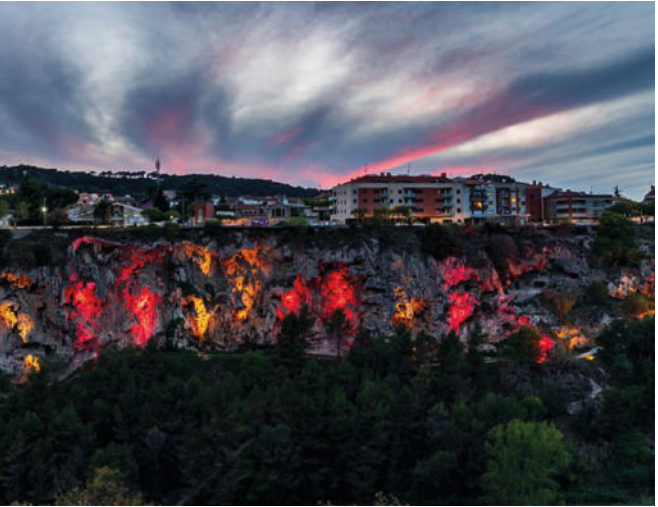
Barcelona (España) - Proyector Milan RGBW