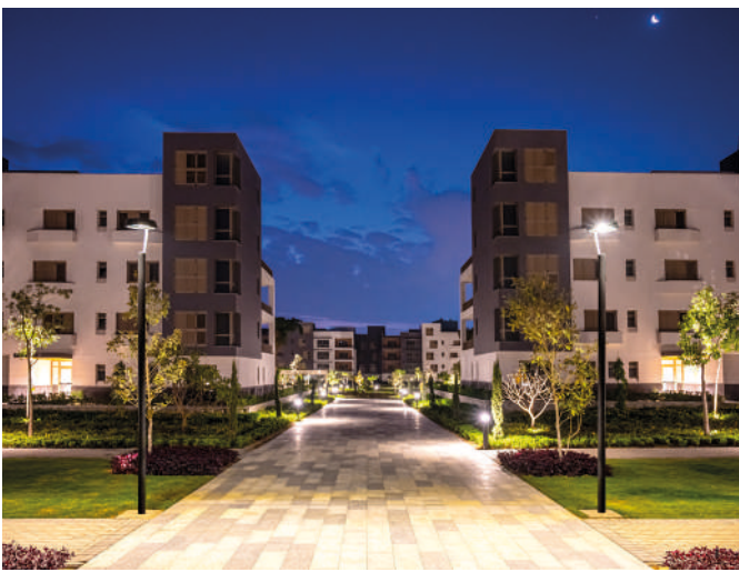
El Caire (Egipto) - Luminaria Deco Lira