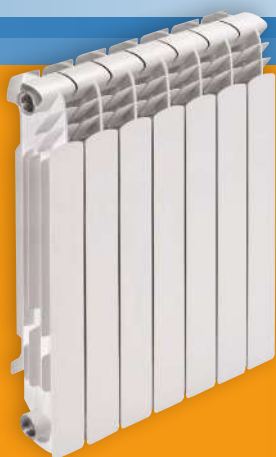
Radiadores de aluminio