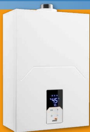
Calentadores a gas