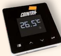
CONNECT SMART WIFI

(ver producto en apartado accesorios pag.32)