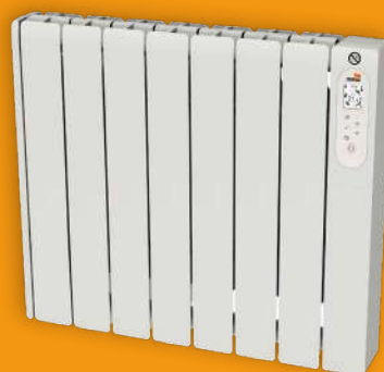
Emisores eléctricos con fluido