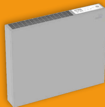
Emisores eléctricos secos