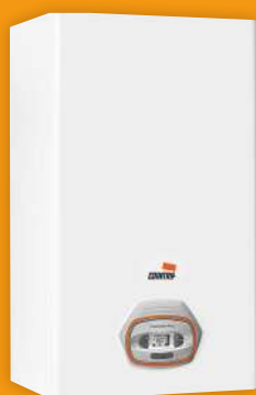
Calderas a gas