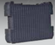
ESPUMA PRE-CORTADA TSTAK DWST1-72364