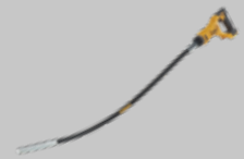
VIBRADOR DE HORMIGÓN DCE531N