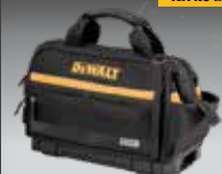
BOLSA CERRADA TSTAK DWST82991-1