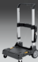
TROLLEY TSTAK DWST1-71196