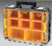
ORGANIZADOR SELLADO TSTAK V DWST82968-1