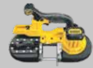
SIERRA DE BANDA 63mm DCS371N