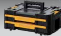
CAJONERA DOBLE TSTAK IV DWST1-70706