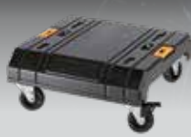
CARRO CON RUEDAS TSTAK DWST1-71229