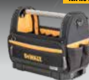
BOLSA ABIERTA TSTAK DWST82990-1