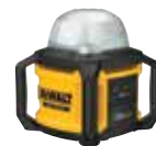
LUZ LED DE ÁREA DCL074