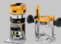
FRESADORA COMBO DCW604NT