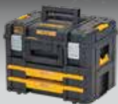
MALETA TSTAK II + CAJONERA DOBLE TSTAK IV DWST83395-1