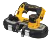
SIERRA DE BANDA 46mm DCS377NT