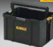
CAJÓN ABIERTO TSTAK DWST1-71228