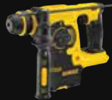
MARTILLO SDS PLUS® 2,1J DCH253N