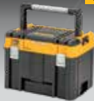
CAJA CON ASA LARGA TSTAK DWST83343-1