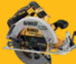
SIERRA CIRCULAR Ø190mm FV ADVANTAGE DCS573NT