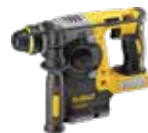
MARTILLO SDS PLUS® 2,1J DCH273N