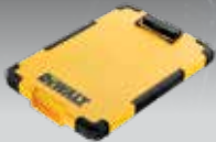
PORTA-DOCUMENTOS TSTAK DWST82732-1