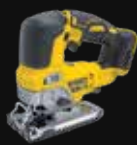
SIERRA DE CALAR DCS334NT