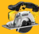
SIERRA MULTICORTE Ø140mm DCS373N