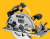
SIERRA CIRCULAR Ø184mm DCS572NT