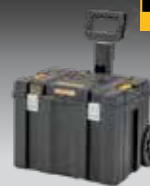
ALMACENAJE MÓVIL TSTAK DWST83347-1