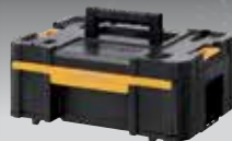
CAJONERA TSTAK III DWST1-70705