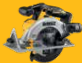
SIERRA CIRCULAR Ø184mm DCS565NT